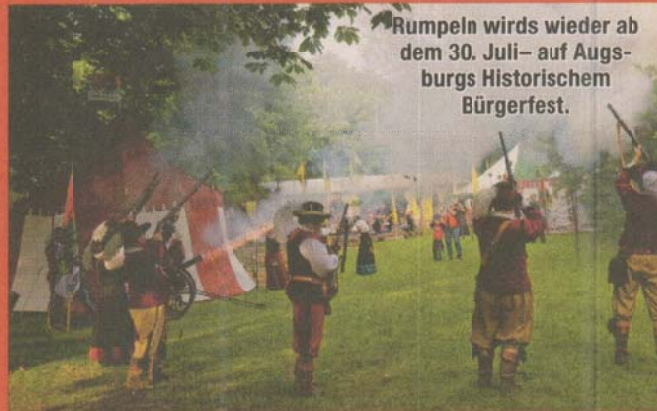
Rumpeln wirds wieder ab dem 30. Juli – auf Augsburgs Historischem Bürgerfest.

Kindern werden Märchenerzähler, eine Holzpferdchen- und eine Kegelbahn, Singen am Lagerfeuer der Landsknechte, Bogenschießen und Stockbrotbacken geboten. Am Mittwoch, 4. August, steht ein Kindernachmittag auf dem Programm.