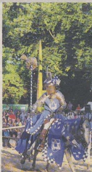
Ein Publikumsmagnet waren am Wochenende die Ritterspiele.