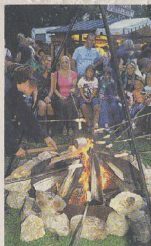
Begehrt: das über dem Lagerfeuer geröstete Steckerlbröt.

Viele Bilder vom historischen Treiben in den Wallanlagen am Roten Tor finden Sie unter augsburger-allgemeine.de/bilder