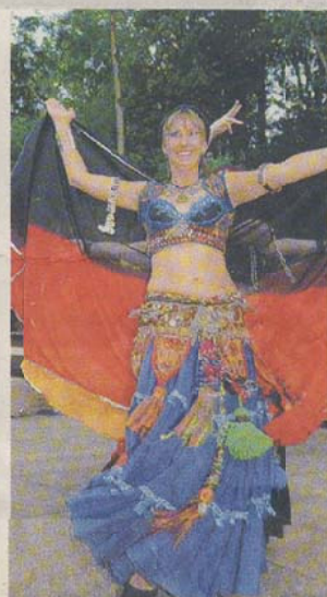
Farbenprächtig: die Bauchtanzgruppe Shikudhanl.